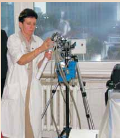
Sprzęt laboratoryjny do pobierania próbek czynników biologicznych prezentowany w laboratorium Wojewódzkiej Stacji Sanitarno-Epidemiologicznej w Warszawie

Biological agent sampling equipment presented at the laboratory of the Provincial Sanitary - Epidemiological Inspectorate in Warsaw