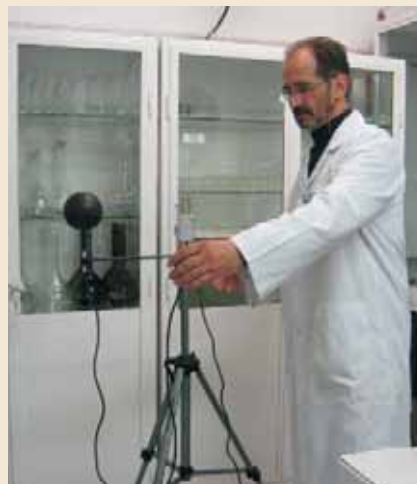
Sprawdzanie miernika mikroklimatu w Laboratorium Wojewódzkiej Stacji Sanitarno-Epidemiologicznej w Bydgoszczy

W stacjach sanitarno-epidemiologicznych organizowane były Dni Otwarte , w czasie których udostępniano odwiedzającym m.in. informacje