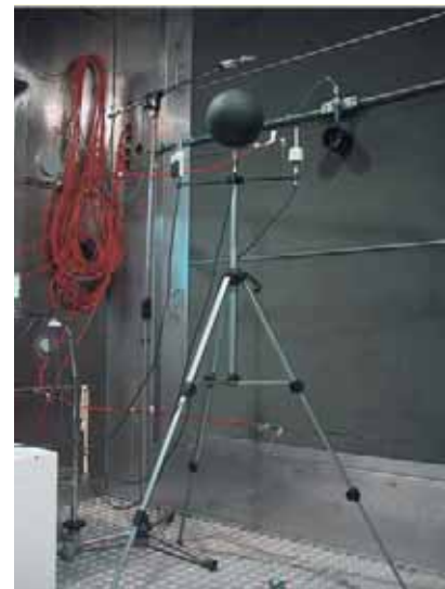
Fot.2. Miernik mikroklimatu MM-01 produkcji polskiej we wnętrzu komory klimatycznej

Fot. 2. Polish type MM-01 microclimate analyzer in the climatic chamber