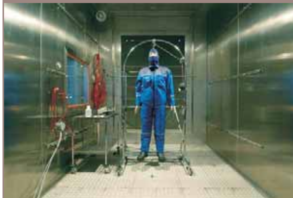
Fot.1. Manekin termiczny wewnątrz komory klimatycznej

Manekin składa się z 16 segmentów, każdy wyposażony we własny system grzewczy i kontrolowany przez indywidualny układ sterowania. Z każdego segmentu uzyskiwana jest informacja o przebiegu lokalnej wymiany ciepła z otoczeniem w postaci wartości temperatury powierzchni segmentu i wartości przenikającego strumienia